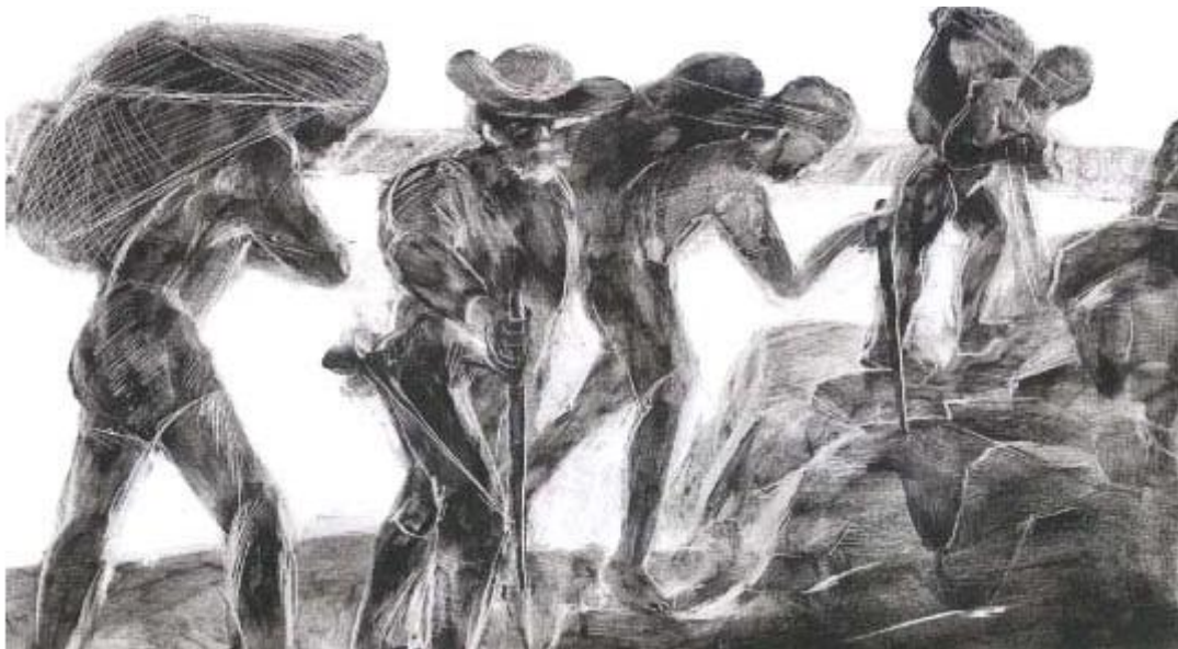
Pinto, Renan de Freitas- A viagem das ideias- http://www.scielo.br/pdf/ea/v19n53/24083.pdf , acesso em 21/04/2013

A imagem nos remete ao processo de formação do pensamento que construiu o território da Amazônia, como um espaço natural e cultural ao dos séculos XVII, XVIII e XIX. O pensamento em vigor nesse período era formado pela ideia do (a)